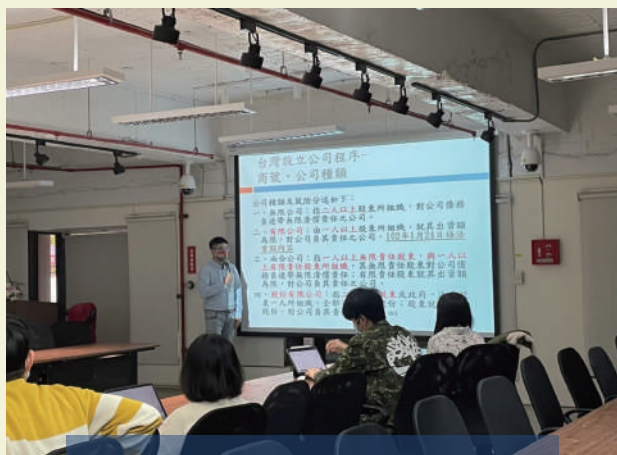
公司設立流程講座

協助基地培育團隊申請成立有限公司，學習開關公司流程及帳務處理。從內部甄選、推薦，到後續開關公司講座、與記帳士面談，創立籌備戶及開設公司申請文件，透過實作了解開關公司流程及注意事項。