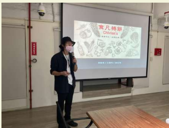
業師輔導會提案說明

一開始沒有經驗、沒有成績，食凡很難找到投資者，成本支出都是靠自己。團隊湊出三萬元的創業金，添購基本的廚房設備，開始販賣健康餐盒，起初一天5個、10個，到後來一天40幾個，慢慢存了點錢，有了一些成績，在中後期遇到了一位投資者，投資了一筆金額，才加速了食凡開店進度。