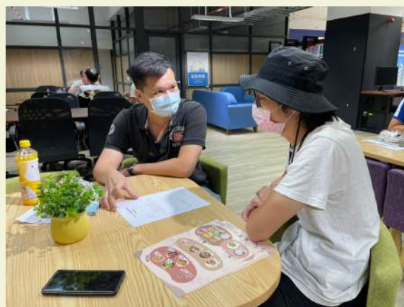
食凡團隊向業師諮詢